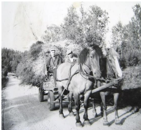
Hölass på Rumma-vägen

När gräset var slaget skulle det hässjas. Då användes en släpräfsa för att samla ihop det slagna gräset i högar eller strängar. Sedan hässjades det nyslagna gräset och fick torka några veckor. Ett annat alternativ var om vädret var stabilt att låta gräset torka på åkern, vända det och sedan med en hästräfsa dra ihop det i strängar och volma höet på störrar.