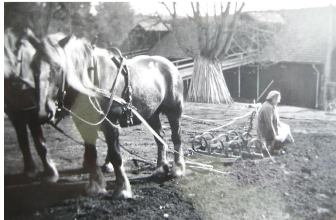
Ella vid ladugården med körbroar

När höet var torrt kördes det in på höladan. I Målen fanns körbroar. När vi skulle upp på logen körde vi upp med häst och vagn i ena ändan och ut genom den andra. Tänk om hästarna blivit skrämde! Men, de var lugna och tålmodiga och åt på sin hötapp medan vi lastade av.