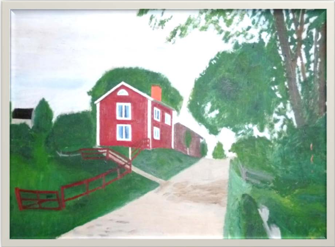
Målen målat med munnen av Karl Rundberg 1950