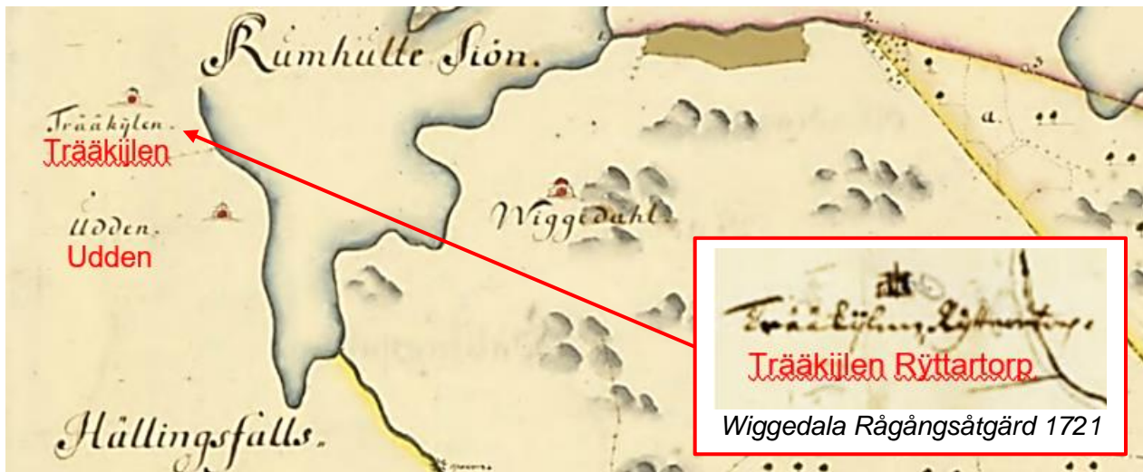
Wiggedahls, Rumhults och Hällingsfalls twistige ägor afmätt år 1721.

När Träkil kom till är inte känt. Första gången vi känner till Träakijlen Ryttertorp är på kartor över rågångsåtgärder år 1721.