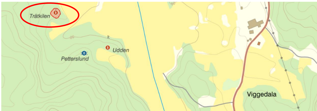
Del ur karta RAÄ Fornsök 2023

Centrumkoordinater (SWEREF 99 TM N,E) N 6454003, E 579344