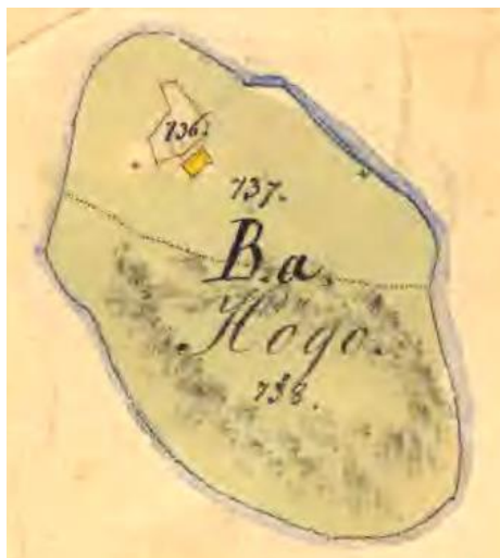
Torpet Holmen på Högo/Bremansö. Del ur karta över Bredal upprättad 1859, Laga skifte 1864.